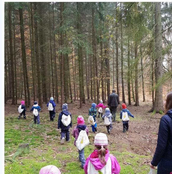
V lese s lesníkem