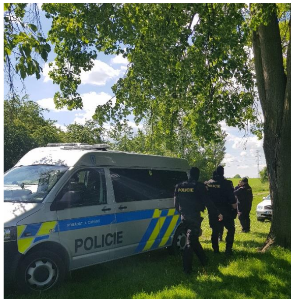
Policie na hřišti