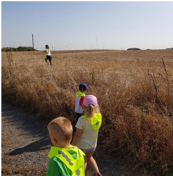
Jsme dobře vidět