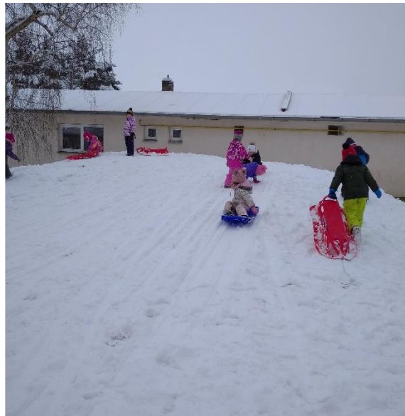
Při sáňkování dodržujeme pravidla