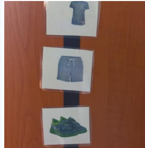
Správně se oblékáme