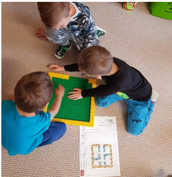
Malá technická univerzita