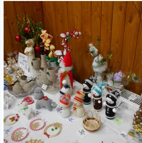
Vánoční výstava na OÚ Malé Přítočno