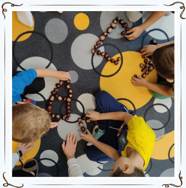
Hry s přírodninami